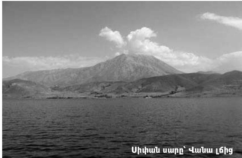
Սիվան սարը՝ Վանա լճից