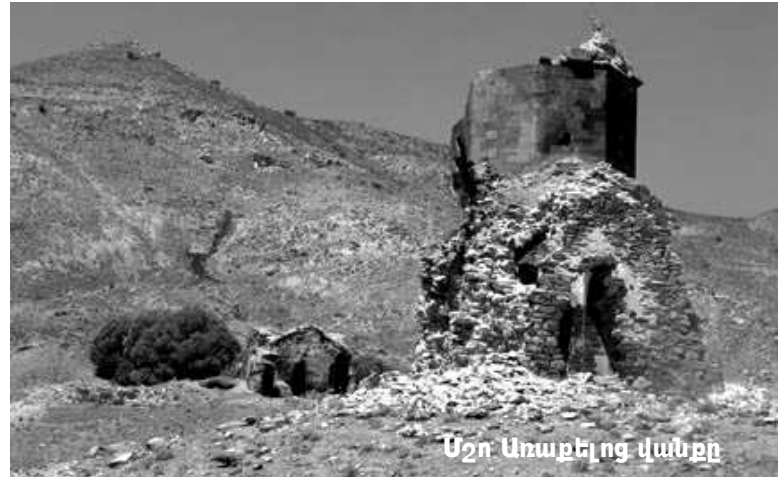
Մշո Առաքելոց վանքի

Ասում են՝ տեղական իշխանությունները, ելնելով իրենց տնտեսական շահերից, առաջիկայում կբարեկարգեն դեպի Սուրբ Առաքելոց տանող ճանապարհը, խապառ փլուզումից կփրկեն վանքը, և Սուրբ Կարապետի հետ միասին այդ երկու ուխտատեղիները կդառնան Մշո շրջանում զբոսաշրջիկների համար այցելության վայրեր, ինչպես Անի կամ Արածանի գետի վրա վերականգնված, նույն Մուշից մի քանի կիլոմետր հեռավորության վրա գտնվող Սուլուխի կամուրջը, որը նույնպես պահ-