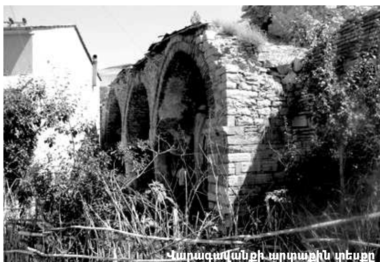
Վարազավանքի արտաքին տեսքը

«Ոսկե օղակում» ընդգրկված հուշարձանների մեծ մասը, բնականաբար, հայկական ծագում ունի, որին, ցավոք, փորձ է արվում իսլամական երանգ հաղորդել: Ինչպես երևում է, Թուրքիան հայկական ճարտարապետական հուշարձանների նկատմամբ որդեգրել է նոր քաղաքականություն, որն այսպես կարելի է ձևակերպել. «Այն ամենը, ինչ ստեղծվել ու կառուցվել է այժմյան Թուրքիայի տարածքում, անկախ ծագումնաբանությունից, Թուրքիայի հարստությունն է և պետք է խնամ-