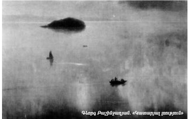
Վերջը Բաշինջադյան. «Կատարյալ լռություն»

«Համուն կայուն մարդկային զարգացման ասոցիացիայի» նախագահ, ՍԱԿ-ի բնապահպանական ծրագրի ազգային կոմիտեի ներկայացուցիչ Կարինե Դանիելյանը ներկայացրեց Ազատի և Ապարանի ջրամբարների՝ իրենց վերջին դիտարկումների արդյունքները (տես ստորև բերվող աղյուսակը), որոնք թեպետ փաստում են ջրամբարների ոչ լրիվ չափով լցված լինելու մասին, սակայն պատկերը տարբեր է նաև կառավարության ներկայացրածից: