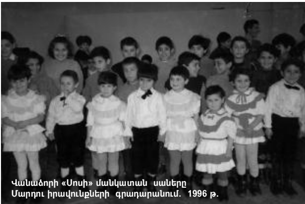
Վանաձորի «Սոսի» մանկատան սաները Սարգոս իրավունքների գրադարանում, 1996 թ.

Նախապատմություն: Երկրաշարժից հետո Սարիբեկյան ընտանիքը աղետյալ Կիրովական (այժմ՝ Վանաձոր) քաղաքից տեղահանվում է՝ հաստատվելով Գուգարք գյուղում՝ այնտեղ գործարան նախատեսված զբոսայգի Օսնիկի շինմանը պատկանող բանվորական ճաշարանը, հիմնելով մի շարք փայտանշակման, գորգագործական օգնության տեղերի, ավտոմարտկոցների, հաց-հրուշակեղենի, կաթնամթերքի և կարի արտադրամասեր: 1992 թ. հուլիսին այստեղ են գալիս Ղարաբաղի Շահումյանի և Մարտավերտի շրջանների բռնի տեղահանված 42 ընտանիքները: Նախկին Գուգարքի շրջանի կոմկուսկոմիտեի և շրջխորհրդի որոշմամբ փախստական ընտանիքներին է հատկացվում արտադրամասերի հարևանությամբ գտնվող բանվորական հանրակացարանը: Գուգարքի նախկին շրջանային կուսկոմիտեի երկրորդ քարտուղար Գագիկ Միկիչյանի և Գուգարքի շրջկոմի նախագահ Ռազմիկ Բոջուկյանի միջնորդությամբ համաձայնության են գալիս, որ փախստական ընտանիքները խնամելի գործը կտանձնեն Լ. Սարիբեկյանի ընտանիքը: Որոշվում է, որ կատարված նյութական ծախսերն ու մատուցած ծառայությունները երկրում իրավիճակի կայունացումից հետո կփոխհատուցվեն: Պետական մարմինները և պարտավորվում են