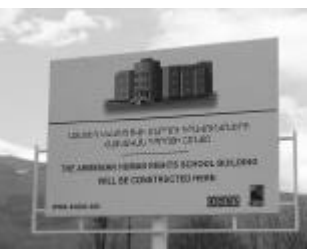
Վել է՝ 1.616.550 դրամ կամ 6466 քար, և կա- տարվել են փոխանցումների խոստումներ՝ 630.500 դրամի չափով (2522 քար): Խոստաց- ված գումարների ստացումից հետո գումարը կկազմի 2.247.050 դրամ (8988 քար):

Ընդհանուր առմամբ դրամահավաք-հե- տուստամարտերի արդյունքում նվիրաբե- րվել է 1.616.550 դրամ կամ 6466 քար, և կա- տարվել են փոխանցումների խոստումներ՝ 630.500 դրամի չափով (2522 քար): Խոստաց- ված գումարների ստացումից հետո գումարը կկազմի 2.247.050 դրամ (8988 քար):