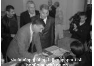
Վանածորիցները նվիրաբերում են իրենց բաժին քարը