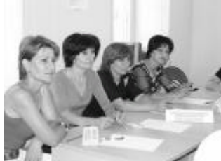
Հասցեն Գյումրիում՝ Երևանյան խճուղի, Տորվեգական թաղամաս, 39 տնակ Հասցեն Ամասիայում՝ Համայնքային գրադարան (2460) 220

Իրավաբանական հասցեն՝ 37 Շիրակի մարզ, Ամասիայի շրջան