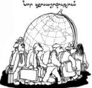
Ընդդեմից Բանաստեղծության ասուց անմեղքների և անցագրերի