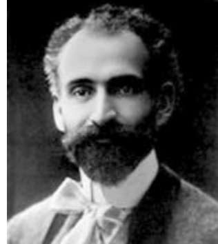
Մինչև վախճանն անվախճանի ըընդունում է դարձ դար:

Մնախ բանից, ըսկզբանից էր չըկան էլ դեռ չըկար,