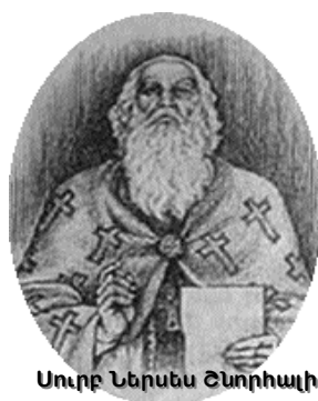
Սուրբ Ներսես Ընդրիակի

«Դարձեալ՝ մեր լեզուն սատանայի գործիքի մի՛ վերածե՛ք՝ չար և դառը հայիոյանքներով, մա- նաանդ՝ որոնցով ա- նարգում է թէ՛ հավատ- քը, թէ՛ ճոգին, թէ՛ Ա- լազանի մկրտութիւնը, թէ՛ մկրտիչ քահանան, թէ՛ անձը և թէ՛ բերա- նը...»