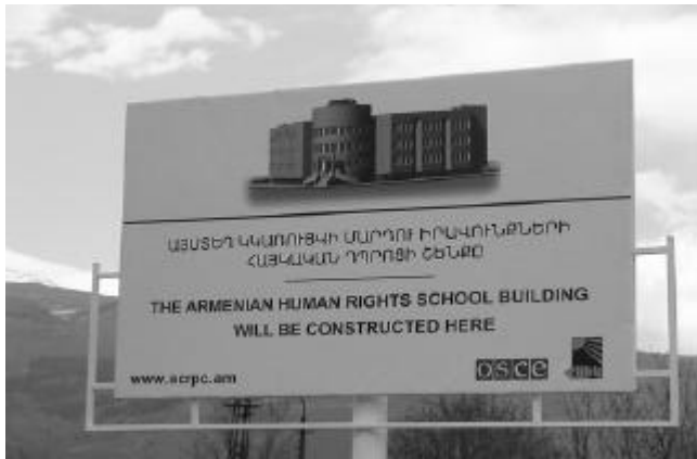
Վանաձոր քաղաքի տարածքում, ներառյալ՝ կենտրոնական պողոտայի վրա, դեռևս կան երկրաշարժից քանդված շենքերի ազատ տարածքներ: Վանաձորցիները թերևս հիշում են կենտրոնական պողոտայի թիվ մեկ հասցեում գտնվող նախկին

Հենց այս դպրոցն է լինելու այն հիմքը, որի շնորհիվ պետք է իրականացվի Մարդու իրավունքների գիտելիքների տարածումը: Մարդիկ կհամանան այն, ինչն օրենքով, սահմանադրությամբ և Հայաստանի Հանրապետության իրավաբանական փաստաթղթերով տրված է նրանց, հաջողությամբ կապաշտպանեն իրենց իրավունքները, հաջողությամբ կմասնակցեն Հայաստանում տեղի ունեցող ժողովրդավարական գործընթացներին: