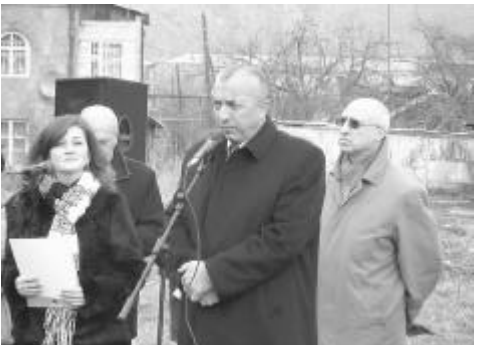
«Սա շատ լավ նախաձեռնություն է, կաջակցե՛ք այս նախաձեռնությանը, քանի որ այն ամենն, ինչ վերաբերում է կրթությանը, մասնավորապես՝ Մարդու իրավունքների կրթությանը, մշտապես եղել է և կմնա կարևորագույն խնդիր, ուստի հենց այս դպրոցը կարող է լինել այն հիմնաքարը, որով կապահովվի ուսուցիչների վերապատրաստման գործընթացը, նախագծերի իրագործումը: Նշված գործընթացներն իրագործվելու են այս դպրոցի հիմքի վրա: Մենք պետք է աջակցե՛ք՝ աշխատելով թե՛ Կառավարության, թե՛ ոչ պետական կազմակերպությունների հետ»:

Գ. Մամուկյանի աշխատակազմն անցած գրեթե երկու տասնամյակի ընթացքում սպասցուել է, որ իր գերագույն նպատակը