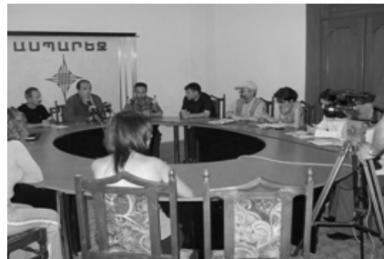
Կան գործակալության ստեղծում:

11. Վերոբերյալ նպատակների իրականացմանն ուղղված հրատարակչական գործունեություն: