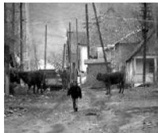
Սատված մի արասցե, եթե երաշտ կամ կարկուտ է լինում, կորուստները կրկնակապակվում են: Կորցնում ենք բերքը և հույսը, թե զոնե հաջորդ տարի հավաքական ուժերով հնարավոր կլինի գյուղատնտեսության գնել: Գյուղատնտեսական բոլոր աշխատանքները կատարվում են բացառապես ձեռքով»,-

Միակ բանը, որից բողոքներ չունեն, հողատարածքներն են: Պրիվոյնյեի համայնքի բնակիչներն զբաղվում են անասնապահությամբ ու գյուղատնտեսությամբ, սակայն այստեղ էլ խնդիրներից չեն խուսափում: «Նախ ոռոգման ջուր չլինելու պատճառով հողային ղեկավարները Սատոն ոռոգման ջրով վրա»: