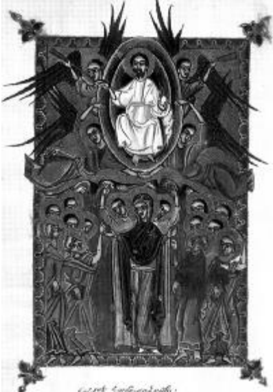
Համբարձում, Եկեղեցու Ղրիմեղու նկարազարդած Ավետարանից, Ղրիմ, 1658: Բրիտանական գրադարան, Չեռ. N Or. 13895, քերթ 12բ:

Այս ավետիսն ամենքիս համար ճառագեց այն օրը, երբ Քրիստոսն այլակերպվեց, երկինքն աղաղակեց նրա Աստվածության մասին, ամառը հովանի եղավ ու մարգարեների հայտնվելով՝ հավիտենությունը բազմեց ժամանակի թագավորության գահին, երկինք ու երկիր մեկ եղան, վերստին փաստվեց, թե չկան ողջեր ու մեռածներ, չկան ծերեր ու մանուկներ, այլ կա անմահ հոգիների հավիտենական թագավորություն, ուր այլևս իշխանություն չունի ժամանակն՝ իր ար-