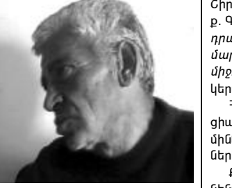
Վերաբերող որևէ բան չէր թողնում նայեմք. « Չափազանցված է », - ասում էր ու նայում երեսիս: Տեսնելով, որ չեմ հավատում, պնդում էր. « Հավատա՛ծիչը եմ ասում », - հիշում է հայրը:

մանակ անգամ սահմանի թռու-րոհից ոչինչ չէր պատմում, խնայում էր ինձ ու երեխաներին, նույնիսկ հեռուստացույցով պատերազմին էլ ավատ