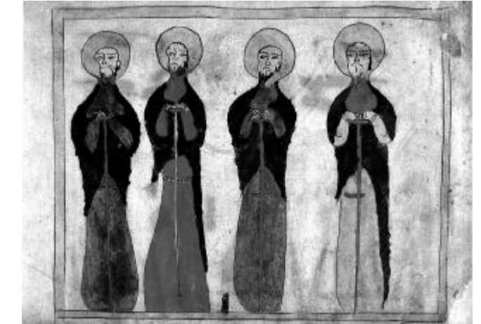
Չորս ավետարանիչները պատկերված են կանգնած. Սեբաստիոն ծաղրկի Ավետարանից, Բերկոլի, 1338: ՍՍ N 4813, թերթ 5բ

«Թող լինի քո կամքը երկրի վրա, ինչպես երկնքում է» 4 բան է նշանակում: Նախ և առաջ, որ ոչինչ չկա Տիրոջ կամքին հակառակ, որն արգելի միանալ Չաղթանակած եկեղեցուն: Եվ ինչպես երկնքում է Աստծո կամքը, նույնպես էլ մեր մեջ թող կատարյալ լինի: Նաև այդպիսով փափագում ենք, որ արմատախիլ արվեն մոլությունն ու մեղքը, և սերմանվեն ճշմարտությունն ու արդարությունը: Եվ նրա խնամքի