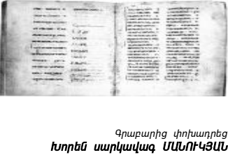
Գրքարարից փոխարդեց խորեն սարկավազ ՄԱՌՈՒԿՍՆ

Ինչպես որ սովի ժամանակ է լիությունը կորչում և չի երևում, այնպես էլ այն՝ այս կյանքի ասածնա, քանզի մահվանից հետո ոչինչ չի երևում, ոչ գուր, ոչ չի շինություն, ոչ՝ փառք, ոչ էլ գեղեկություն և ոչ էլ որևէ բան, որ այս կյանքում է, քանզի ամեն ինչ հավաքվում է: