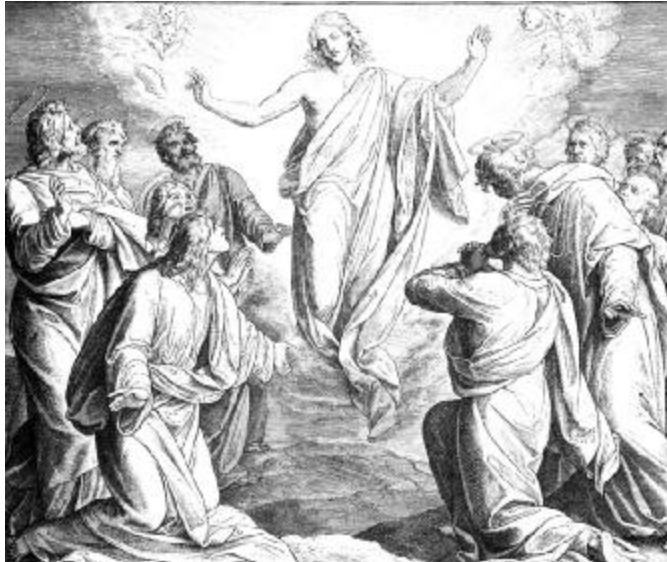
ՅՈՒՆԻԻՍԿՈ ՇՆՈՊՊ ՖՈՆ ԿԱՌՈՒՍՅԵԼԻ . Համբարձում

Տիրոջ մշտական ներկայության խիստ ընդ համակված՝ ամեն տարի այդ օրը ցնծում է ժողովուրդը՝ զարմանալով ավետիսը միախուսելով Քրիստոսի համբարձման պայծառաշուք տոնին: Քրիստոսը Չիբենյաց լեռան վրայից երկինք բարձրանալով՝ նոր կյանք տվեց աշխարհին, և այս նորն իրենց վրա առան մարդիկ՝ ծաղկեպսակներ